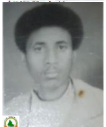
ዘ15ቀ27 ዘፊዑን በጉቲ H15K27 Zerhin Benti